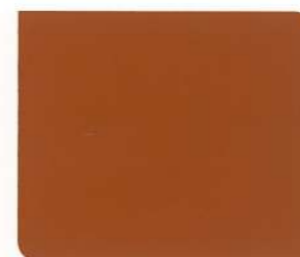
NRC842 Tile Redwood