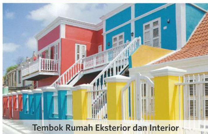
Tembok Rumah Eksterior dan Interior