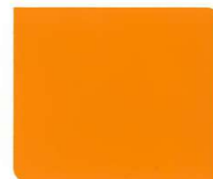
NRC830 Light Orange