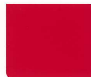
NRC838 Sunrise Red